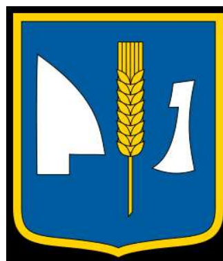
Konyár község címere

Elérhetőség: Konyár Község Önkormányzata 4133 Konyár, Rákóczi u. 24. Telefon: 54/539-500